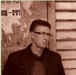
לאפשר לכוחות היצירתיים לבטא את עצמם בירושלים

בימים אלה מתארגנת קבוצה נוספת (צפונית) של 'משבי רוח'. אנו מזמינים עוד צעירים (25-45) להצטרף אלינו לשתי הקבוצות – הדרומית והצפונית. פרטים ב: amudim@kdati.org.il .