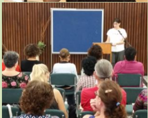
הכוונה לא רק לדבר על שיתופי פעולה אלא לקיימם בשטח