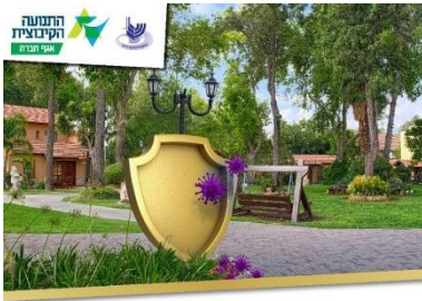
מגן קיבוץ אחריות קהילתית למוגנות מפני קורונה בקיבוץ

בימים אלה מתמודדות הקהילות שלנו בקיבוצים כמו, קהילות וקבוצות אחרות בישראל, בסוגיות שונות הנוגעות לשאלת החיסונים. חלק מהציבור לא התחסן מסיבות שונות. לא ניתן לחייב או לנקוט סנקציות אך הנושא חשוב, בוער, ודורש התייחסות מערכתית, לפחות מצד ההסברה והתודעה. לשם כך יזמה מחלקת בריאות ורווחה בתק"צ, בשיתוף עם הקבה"ד מפגש עיון ולמידה ביום ראשון הקרוב (14.2.2021). במפגש ישתתפו פרופ' נדב דוידוביץ' - מנהל ביה"ס לבריאות הציבור באוניברסיטת בן גוריון, הרב איתמר חייקין (מכינת רוח השדה), ועו"ד מירב ניב. פרטים. קישור ולוחות זמנים באתר