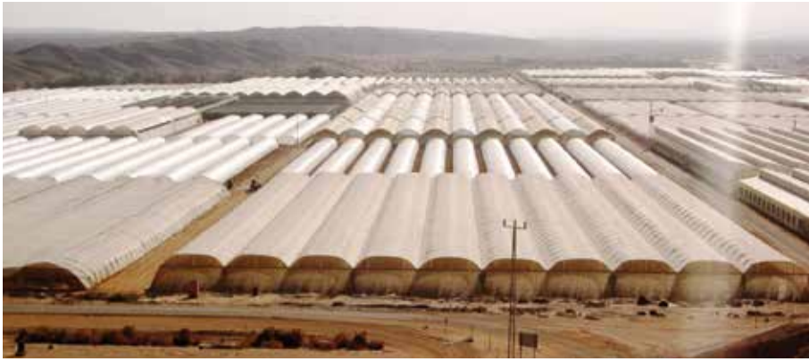
חממות בערבה התיכונה