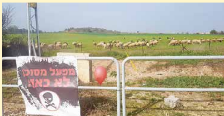
הכרזה של מטה המאבק נגד הקמת מפעל הסוללות

מפעלים עם חומרים מסוכנים ליד אנשים. המטה החל במאבק כדי לגרום לשינוי - שימנע אסון! בלב ריכוז אוכלוסייה נמצא מפעל שמ' עתיק עצמו ללב ריכוז אוכלוסייה אחר. התנהלותו של המפעל חוקית ותקינה - רק חסרת היגיון. אף אחד לא מבטיח שלא תקרה תקלה, שלא תהיה דליפה. שלא יקרה שום דבר. אף אחד לא מבטיח! אז למה לקחת את הסיכון? בואו נמנע את האסון הבא. חומרים מסוכנים לא ליד אנשים. לא כאן!"