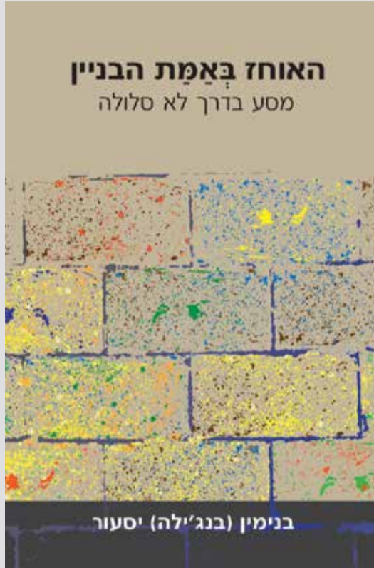
הספר מוסיף פרק חשוב בהיסטוריה המפוארת של מחלקת התכנון של הקב"א

ב-25 לינואר 2019 יום שישי בשעה 10 תתקיים השקת הספר במעמד חגיגי, בבית