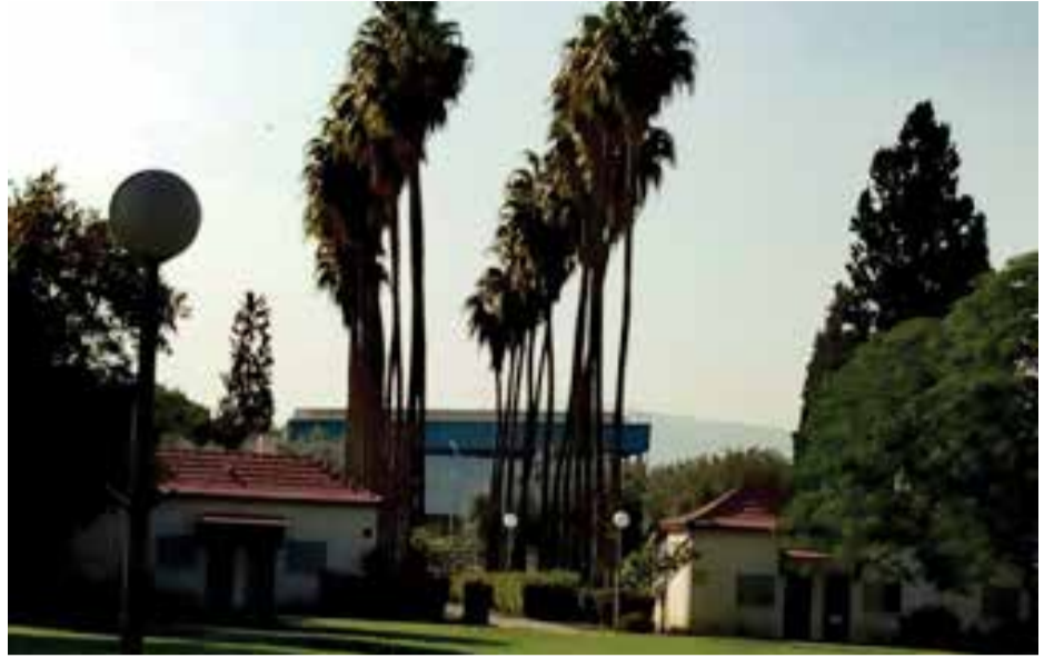
הדשא כיום על רקע שדרת הווינגטון