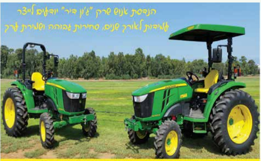
הנכסת אנוש שרק "ג'ון דיר" יודעים איך לייצר אמינות לאורך שנים, סחירות גבוהה וסלירות לרק

מנועי דיזל 4 צלינדרים בהספקים של 49/65 כ"ס.