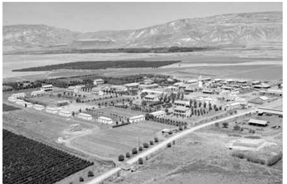
אשדות בראשיתה - מראה כללי

השנה יוענקו מלגות לסטודנטים - ניצן שגב, סטודנטית לתואר PhD באוניברסיטת בן גוריון, החוקרת את השפעת הזיהום הסביבתי על החי והצומח. אמיר לוין, סטודנט לתואר PhD באוניברסיטת תל אביב, החוקר את השפעת ממשק המים והשימושים בקרקע במדבר לחקלאות, על