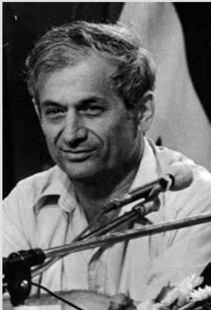
בנג'ילה. "אני מביט קדימה, ועוד רבה המלאכה"

"אני מופתע לטובה מהספר. התגובות חיוביות מאלה שקראו אותו. הוא מבטא את הוויכוח שהייה לי בקיבוץ על החברה הקיבוצית ועל הנושא המדיני של מלחמה ושלום. תמיד בשאלות המרכזיות הייתה לי עמדה ברורה. הייתי צד בוויכוח. הספר ממקד למעשה את המשנה הפוליטית והחברתית שלי, ומה הרקע של הדברים. בסופו זה ספר היסטורי, ספר של תקופה!