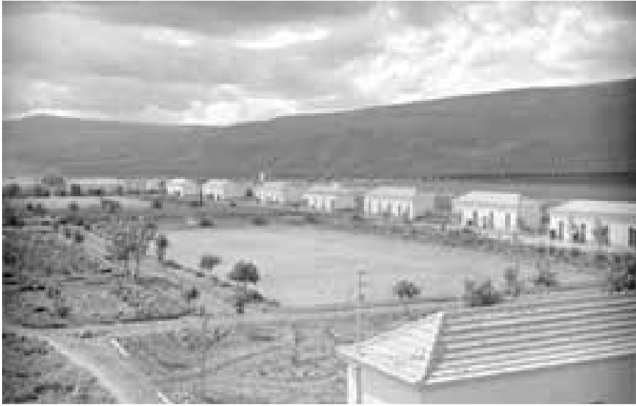
מדשאה טיפוסית באשדות יעקב - שנות הארבעים