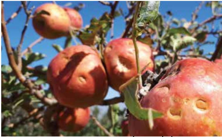
נזקי ברד בחפוח