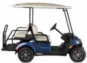
רכבים תפעוליים בנזין/ חשמלי