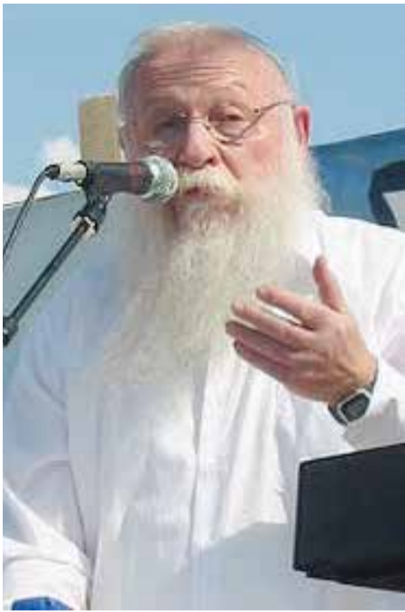
הרב דרוקמן. לא מודה בטעות, לא מתנצל