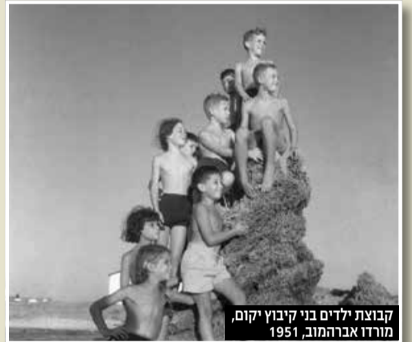
קבוצת ילדים בני קיבוץ יקום, מורדו אברהמוב, 1951