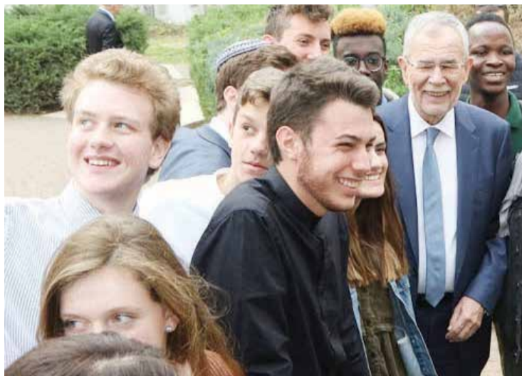
נשיא אוסטריה במחיצת תלמידי בית הספר הבינלאומי למנהיגות ושלום

"למפלגת הירוקים" ולגבעת חביבה מטרות משותפות לא רק בנושאים של איכות הסביבה, אלא גם בנושאים של שלום, קירוב, שיתוף ושוויון בין אוכלוסיות שונות", אומר נשיא אוסטריה. "לנו באוסטריה יש גם קשיים ביחסים בין אוכלוסיות שונות, אם כי לא ברמה כמו אצלכם. אנחנו יכולים בהחלט ללמוד בנושא זה ממה שאתם עושים בגבעת חביבה".