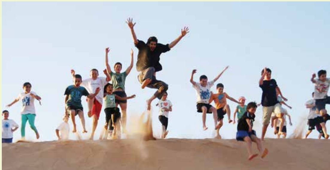
"החינוך הוא ליבה של הקהילה"

ה"יחד" שיתן לכולנו את אפשרות לפעול כ"רשת החינוך הקיבוצי", מרחב פעולה המכבד את השונות ומעצים את המשותף, מחזקת את עוגני החינוך הקיבוצי ומאפשרת את חיבורם לזהות הייחודית של כל קיבוץ וקהילה. אני קוראת לכולנו לחבק קרוב וחזק את החינוך הקיבוצי ולהעניק לכל ילדי הקיבוץ ציפים ומשפחותיהם את הזכות לגדול במערכת שמבוססת על ערכות הדדיות, מחנכת לכבוד הדדי, שוויון בין שונות, אחריות חברתית, אהבת הארץ ויצירת עצמית".