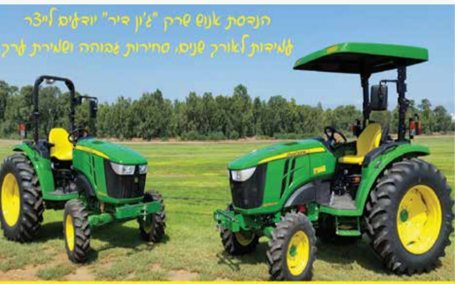
הנדסת אנוש שרק "ג'ון דיר" וידידים אי-3 ר לאיכות לאורך שנים. סחירות גבוהה וסלירות לרק

מנועי דיזל 4 צלינדרים בהספקים של 49/65 כ"ס.