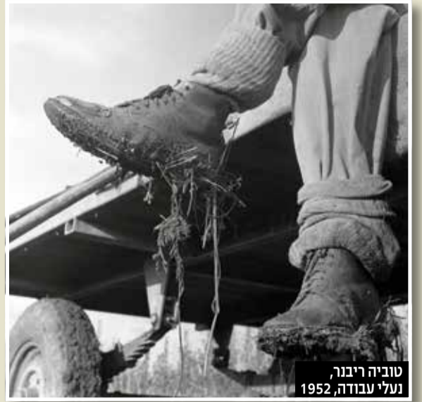
טוביה ריבנר, נעלי עבודה, 1952