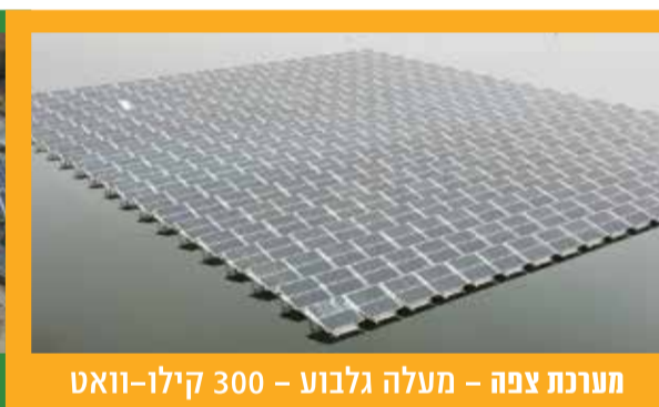
מערכת צפה - מעלה גלובע - 300 קילו-וואט