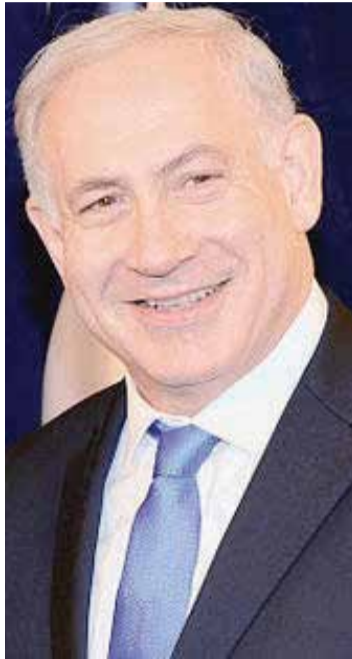
נתניהו הולך ומעמיק את הקרע הפנימי, כי הוא נבנה מתמו. ישראל הופכת לבייסוקרטיה - שלטון הבייס

דמוקרטיה מחייבת איזונים ובלמים, כדי להבטיח שתהיה מדינת חוק, שתבטיח את זכויות המיעוט ואת זכויות הפרט. מערכת משפט חזקה היא חלק מאותם איזונים ובלמים.