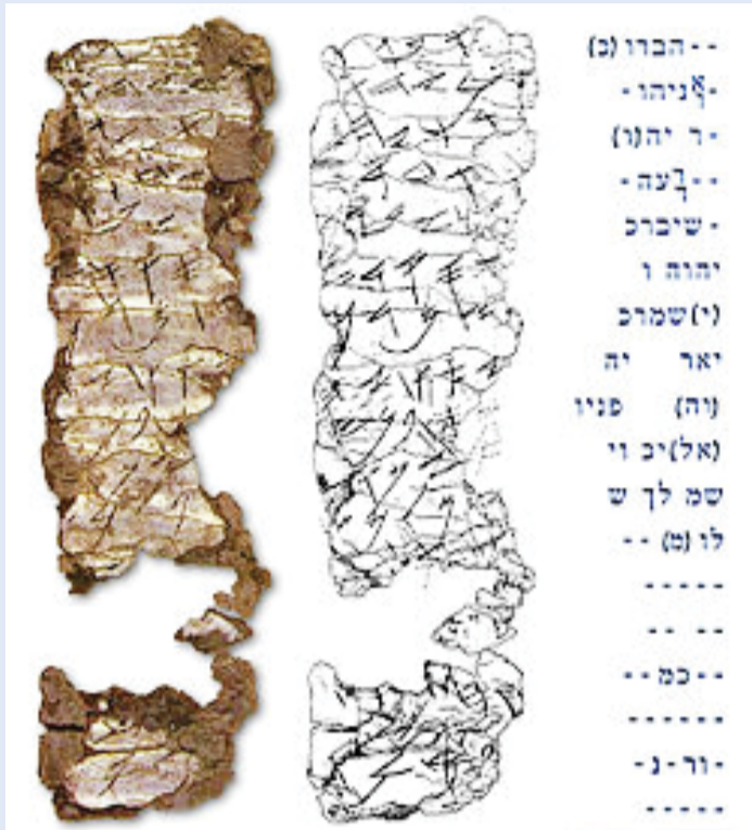
תמר הידני - ברכת כהנים

והמגבלות, רבים מהכהנים מהי בית הראשון והשני, הושחתו והיו מביניהם שנפלו למנעמי השררה ותאוות הבצע. הנביאים תפסו את מקומם כ"כהני אמת", והיו לדור גמא למוסריות ולהנהגה רוחנית של העם. כך למשל החשמונאים שהחלו את דרכם ככהנים, שניחנו בתכונות של גבורה, נכסו לעצמם בהמשך גם סמכויות "אזרחיות" והיו למלכים. אפשר אולי להקביל את מעמדם לזה של לומדי התורה דהיום, הפטורים ממצוות חילוניות כגון שירות בצבא, התפרנסות, תופעה המובילה לשחיתות, ממש כמו הימים ההם. הרב בנות הראשית על שלל מועסקיה והממון הרב הכרוך בפעילותה אינה חפה מהחטאים הללו.