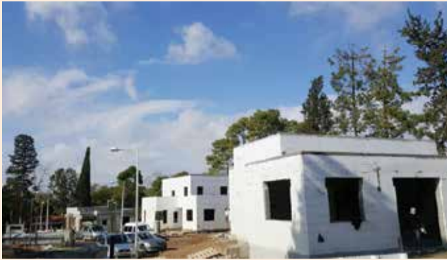
בית ממוגן בעוטף עזה

בעקבות העימותים עם המאס וירי טילי הקסאם בחודשים האחרונים, ב-2019 ייבנו כ-300 בתים ממוגנים, בעוטף עזה וביישובי הדרום הסמוכים. הבתים בנויים מקירות של בטון מזוין, בדומה לקירות הממ"ד, והם בעלי עמידות גבוהה לפגיעות הרף, לפגיעות של רסיסי טילים ורסיסי רקטות.