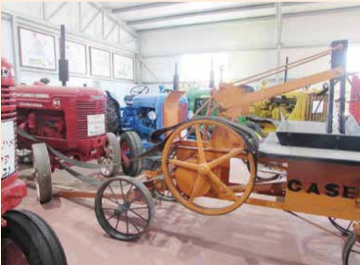
תערוכה של טרקטורים ישנים משופצים ומכונות חקלאיות