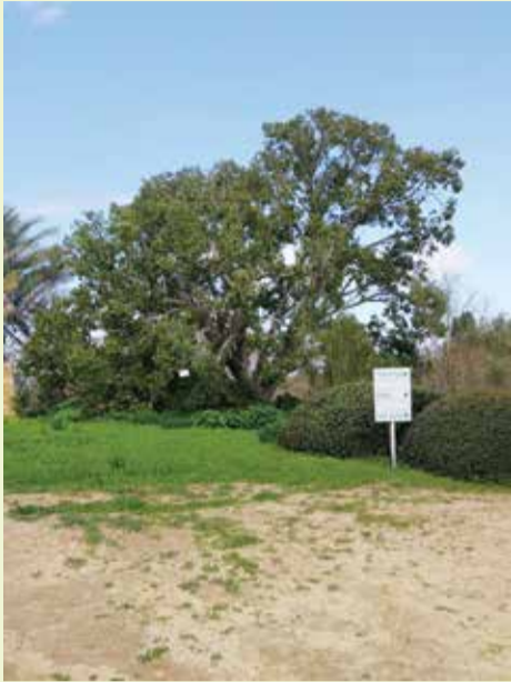
גבעת תום ותומר. מזמנים לבקר

אלמונים הש- חיתו בלילה שבין שבת לראשון, חלקים בגן הבוטני שבגבעת תום ותומר סמוך לקיבוץ נגבה וגנבו רכוש. הגנבים פירקו את הכיור בחוץ, את מערכת המים לשי-רותים, את אסלת בית השימוש ולק-חו עמם את החל-נות של השירותים. הוגשה תלונה למ-שטרה וטרם נעצרו חשודים. אתר ההנצחה והגן בוטני גבעת תום ותומר, הוקמו