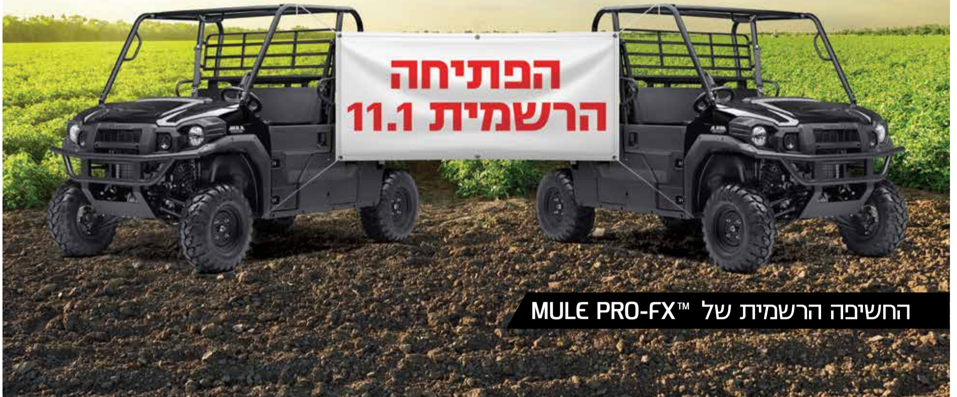
החשיפה הרשמית של MULE PRO-FX™

אולם תצוגה חדש המתמחה ברכבים תפעוליים וטרקטורי משא נפתח בקיבוץ מענית לרווחת תושבי עמק חפר והסביבה. בואו לחגוג באירוע הפתיחה, יום שישי ה-11.1 | 9:00-15:00 עם אוכל טוב, שתייה טובה ומחירים מיוחדים על מגוון הכלים, ותיהנו גם ממתנה אישית.