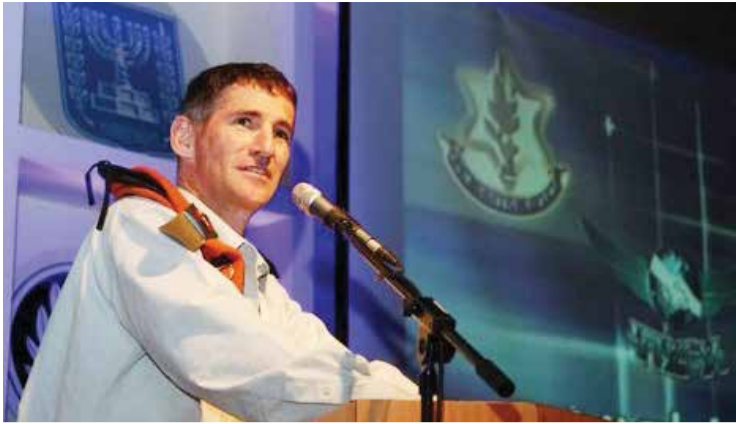
האלוף במיל' יאיר גולן, צילום: דו"צ. תכנים חשובים להנהלות הקיבוצים, על הקיבוצים עצמם ועל החברה בכלל