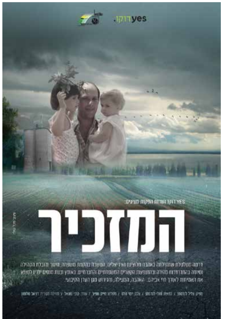
הפוסטר של הסרט "המתזכיר"

לפני שנים לא רבות התרחשה דרמה בקיבוץ חולתה: אחד האנשים המרכזיים בקיבוץ נתפס בגניבה והקיבוץ אמר לו, תעזבו מיד ותחזיר את הכסף, בכך נסיים את הפרשה. בסיפור הזה ובהשלכותיו הטרגיות, עוסק סרטם של צמד היוצרים הוותיק מולי וצליל לנדסמן, שיוקדן השבוע ב־Yes דוקו. סרט לא קל, שבסופו לא נשמעות מחיאות כפיים אלא משתררת דממה מעיקה