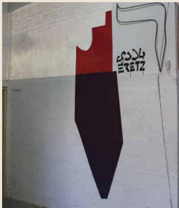
תערוכה אופטימית בעיקר במסר שלה, אפשר לטייל בארץ

בכניסה לגלריה מקבלת את פנינו דמותה הגרפית, המינימליסטית של ארץ ישראל בצבעי סגול ובורדו ובשלוש שפות כמו נערה חטובת גורה. על מפת הארץ כחלק בלתי נפרד מהיצירה מוקרן סרט וידיאו שהוא פתיח למסע אותו אנו עתידים לחוות בהמשך... סרט הנע בין צורות והבוקי אור וצבע מופשטים לנגיעות שדה ממשיות. ומה שמקשר ביניהם היא התנועה הבלתי פוסקת של אותו מסע, ברכב, רכבת, חמור או מטוס. לצערי בשעה שנכנסתי אל הגלריה רעשו מקדחים שחוררו חורי חשמל בקיר ולא אפשרו לי לשמוע את הסאונד המלווה את היצירה בכניסה. בהמשך נכנסתי אל אולם הגלריה ושם התיישבתי לראות ולשמוע את צלילי המוסיקה ללא רעשי רקע צורמים. ואכן היצירה המרכזית לרוחב כל הקיר בנויה לתלפיות משלוש יחידות שוות: במרכז הקיר מוצב מסך וידיאו שפועל בלופ ללא הפסקה. הווידיאו מקריז את מסעו של רפי על פעילותו היוצרת. מימין ציור נוף בצבע, בסגנון המינימליסטי - שדות שבעמק או בפרשנות שלו "סודות שבי עמק". ואז הדמיון מופעל: איזה סודות כמוסים העמק אוצר בזיכרונותיו? האמינו לרפי שהוא יודע... מצד שמאל ציור נוף שני של ארץ אהבתו, נוף עם ברושים וסוס דוהר במרחבים ועל היצירה רשום: "אשים בערבה ברוש תדהר ותאשור - יחדיו" (ישעיהו פרק מא). סוס דוהר לאורך הברושים. איזה צירוף אולטימטיבי של סמלי הארץ. אני מכיר סוס מברונזה שעליו יושב אלכסנדר זייד, מעל "הסודות שבעמק". אצל רפי הסוס ברח מהשומר... ישבתי על ספסל לבן מול היצירה