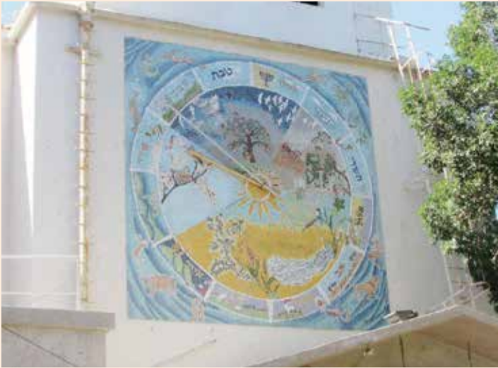
פסיפס עונות השנה, מבוסס על ציור של האמן אריה חצור, על מגדל האסם

הקיבוץ הכי גדול לשעבר בארץ ובעולם, מציע לקבוצות מטיילים ואורחים ביקור במרכז ההיסטורי, שכולל הצצה אל שוכן יונים צה"לי מהסוג ששימש השראה לספר "יונה ונער"