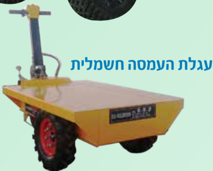
עגלת העמסה חשמלית