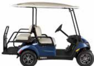
רכבים תפעוליים בנזין/ חשמלי