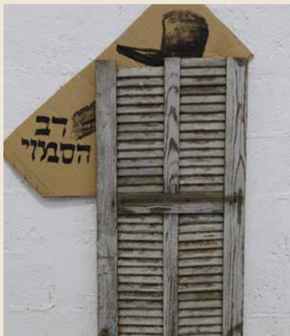
"רב הסמוי". כל אחד יכול להשלים את המשפט....