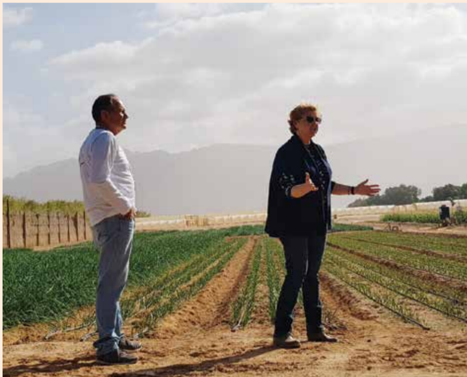
סיור במו"פ ערבה דרומית. "חקלאות כענף מרכזי בחבל הארץ המיוחד"

בשבוע שעבר התקיים במו"פ חבל אילות ובמועצה האזורית הסמוכה לקיבוץ יטבתה יום החקלאות בחבל אילות, שהתקיים השנה תחת הכותרת - "אתגרי המחר"