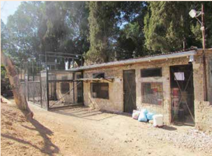
שוכן יונים צה"לי, מבנה מלבני בן ארבעה חדרים, היחידי ששרד ושחזר