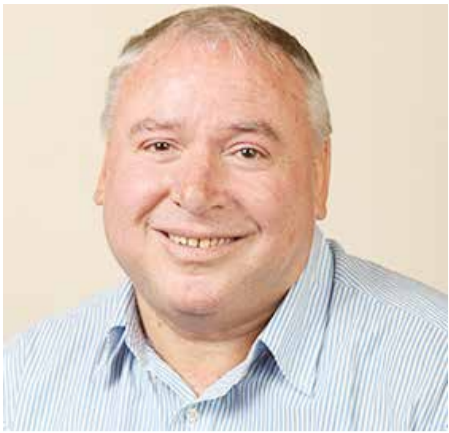
חה"כ אמסלם. מאשים שוב את המשטרה בהובלת ניסיון הפיכה נגד נתניהו

אחד הדברים המעניינים אצל יאיר נתניהו זוהי תחושת הנרדפות שיש לו. איך יודעים שיש לו? בתגובה לפוסט שכתבה זהבה גלאון, בו תקפה את אביו ואתו כינתה זנאי, שיבץ נתניהו הצעיר את המשפט הבא: "תראו כמה אלימות מילולית מצד ה'נאורים'. אף אחד לא מעיז לדבר ככה לאף בן או בת של פוליטיקאי