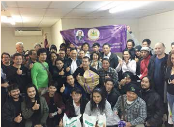
שר העבודה התאילנדי בחברת עובדי החקלאות במצובה ועובדי מילופרי.