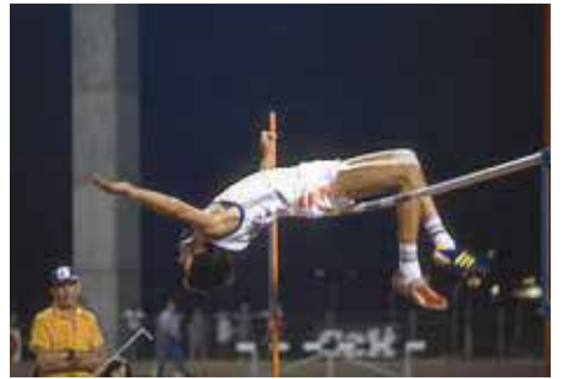
הרמט במכביה ה'11, יולי 1981.