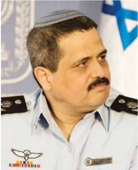
אלשיך. כשנתניהו הציע לו להיות ראש השב"כ בתום כהונתו כמפכ"ל, הוא לא הבין מה נדרש ממנו?