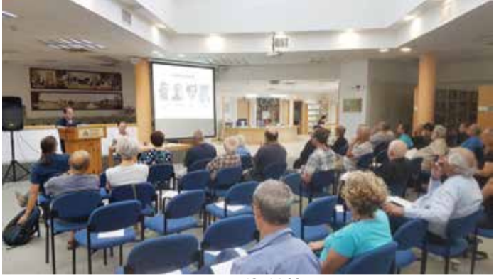
כנס חוקרי הקיבוץ, גבעת חביבה, 14.09-13

הדין במושב המסכם של כנס חוקרי הקיבוץ היה בעל אופי היסטורי בעיקרו, והודגשו בו הצלחתו של הקיבוץ במפעל ההתיישבות ובביטחון הלאומי עד להקמת המדינה ובשנותיה הראשונות, מחד, וכישלוננו להיות דגם לשינוי חברתי, מאידך