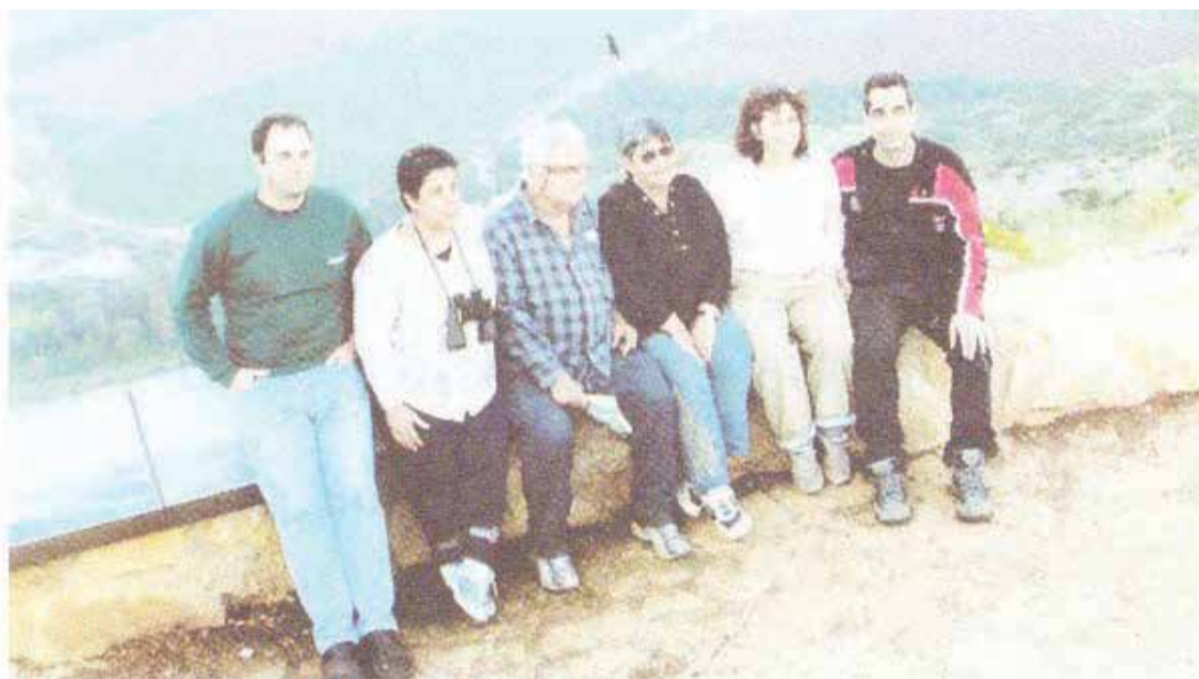
עם דליה וארבעם הילדים בטיול בצפון

לצד החברתי-תנועתית. לא היו מדריכים אחרים, והייתי לבדי די הרבה זמן. הפעילות נגעה בכל, מענייני ארגון ועד תרבות, במגמה ליצור תשתית של אורח חיים שיתופי. היא כללה הדרכה בניהול ישיבות מזכירות, טיפול בזוגות במשבר וגם קטיפי וברור כאב הלב שלו בעת ביקורו באזור לאחר פינוי יישובי פתחת רפיח. ראויה לציון תרומתו לעיירה שדרות בתחום החינוך. הוא נענה לפנייה לשמש כמנהל בית הספר המקיף בשדרות, בזמן שבת הספר לא היה "אטרקטיבי", ותלמידים טובים נשלחו ללמוד במקומות אחרים. מק הצליח לשכנע הורים ולהרחיב את ההרשמה לבית הספר. הוא הצליח לקבל ממשרד החינוך אישור על מתן ציוני מגן, ובכך להגדיל את מספר הזכאים לבגרות. חשוב היה לו לשמר את מגמת הסיעוד, למרות שהיו מתנגדים לה, ועוד. הוא מתאר בפירוט ובהתלהבות