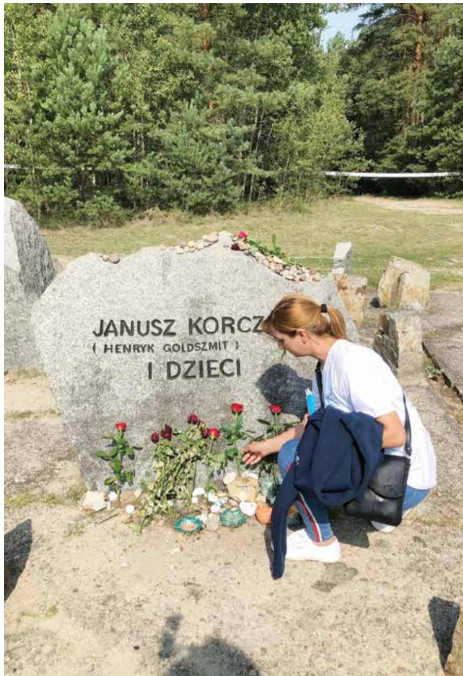
טיגלית מניחה פרח על המצבה לזכרו של יאנוש קורצ'אק באתר הזיכרון בטרבלינקה

רבים נוטים לפרש את המושג ערבות הדדית בעיקר בהיבט הכספי שלו. עזרה כספית לנזקקים לה היא ודאי ביטוי של ערבות כזאת (גם אם לפעמים נראה כי היא ניתנת בעירובן מוגבל) אבל ערבות הדדית אינה מתמצה בה. יש לה ביטויים