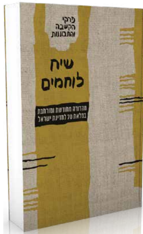
עורכי המהדורה המחודשת חושבים שיש ממד אקטואלי ורלבנטיות לספר גם בימינו אלה

הקובץ "שיח לוחמים" הופיע פעמיים במהדורה פנימית בקיבוצים ועיצובו הפשוט לא נבע מיומרות "פלצנית" כלשון תום שגב, אלא היה פרי של חוסר אמצעים שתוצאתם שימוש בהדפסה זולה, עיצוב פשוט ביותר, שנעשה בידי מתנדבים, ושימוש בכריכה מנייר זול ביותר - נייר שהיום כבר אי אפשר למצוא כלל