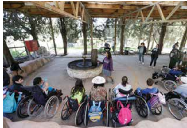
פעילות נגישה בחוות עמק השלום

חות עמק השלום הוקמה על ידי נוצרים שהטיפו לשלום בעור'ם להם והתכוננו במרץ לסוף העולם. הם לא דמינו שמחזון אפוקליפטי זה תצמח פעילות ארוכת שנים עם חזון לחברה שוויונית וערכית, הקובעת שלכל אדם זכות ליהנות מהטבע. עמותת לטם פועלת במקום כבר חצי יובל להנגשה של הטבע לאוכלוסיות עם צרכים מיוחדים. מפעילות שהתחילה