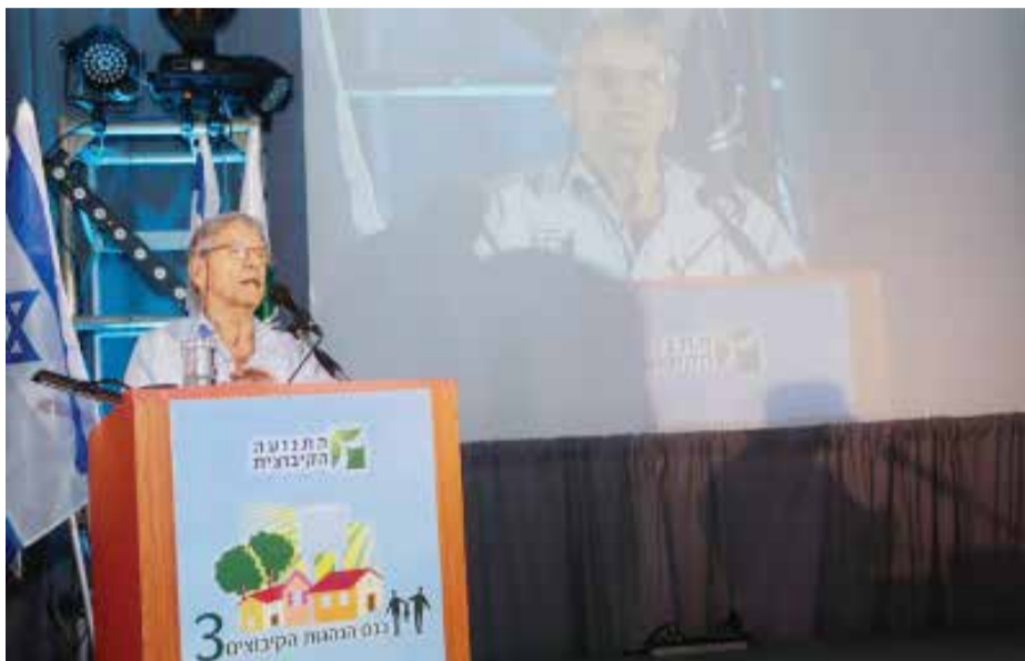
שגב קובע באירוניה, שמה שמצדיק את הפרסום המחודש של הספר, הוא שאחד מעורכיו הוא עמוס עוז. אלא שעוז לא היה מעורב כלל ביוזמה להוצאה המחודשת של המהדורה

ו - הוא יוצר רושם לפיו מן העדויות שהוקלטו