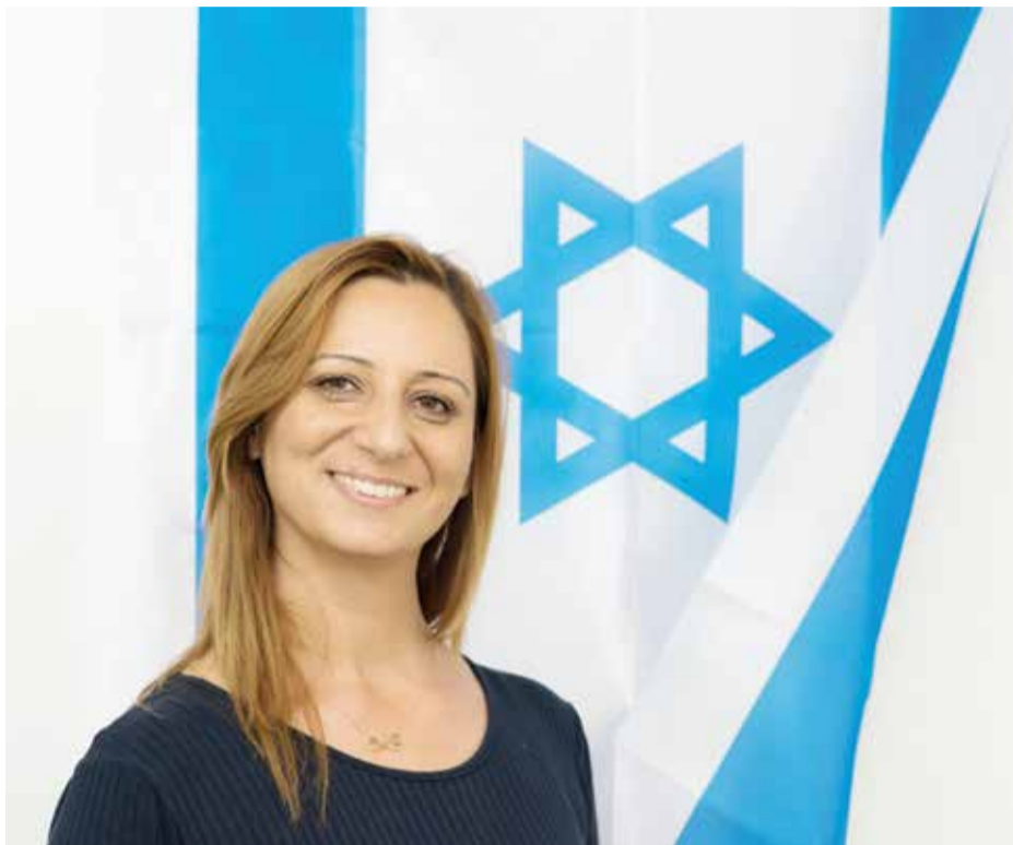
זו שנה ראשונה שהיא מחנכת י"ב, וזו זכות גדולה, היא אומרת. "אתה כבר רואה את הפרי, ויש לי חלק בו. אני מרגישה שיגדלתי ילדים. מכיתה י' ועד י"ב, בתקופה הכי משמעותית בחיים שלהם. אני מאוד גאה על כך".

"לתפארת. מצד אחד הם הרכינו שם ראש. מצד שני הם הניפו שם דגל. הייתי מאוד גאה בהם. במהלך המסע, בטקס קבלת השבת שעשינו, חילקנו לתלמידים מכתבים מההורים. מכתבים שיש בהם גם אהבה, גם פריסת שלום, וברוך כלל גם קצת ענייני מורשת ומולדת. גם אנשי הצוות קיבלו מכתבים. היה מי שדאג שהם יקבלו. גם אני קיבלתי מכתבים. ממנהלת בית הספר, ממנהלת השכבה הבוגרת, ומרכזת המתמטיקה בתיכון (אחת הסיבות למסע