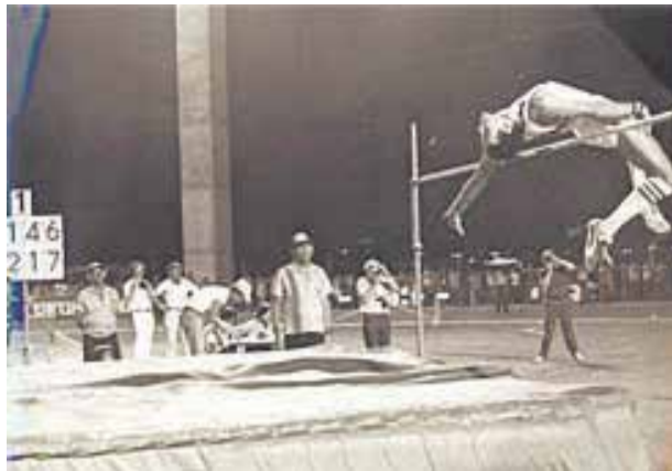
סגנון הפוסברי של הרמט.