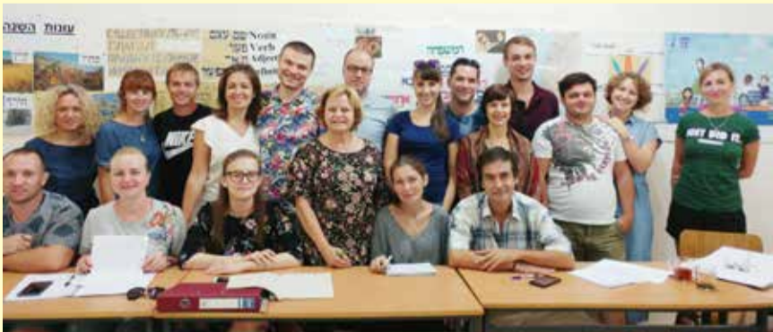
הקיבוצניקים החדשים בגליל

המשפחות הראשונות נקלטו ביראון, יפתח, משגב עם, כפר גלעדי, הגושרים, להבות הבשן, נאות מרדכי ואיילת השחר. במחזור השני יצטרפו מלכיה במנרה. הלימודים באולפן יימשכו בחודשים הקרובים, ואחרי שנת התכנית, מבקשת המועצה להציע למשפחות להילקט למגורי קבע בקיבוצי הגליל העליון.