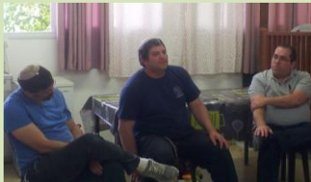
כיצד לא מכבים את החלום היזמי ומאיך אך שומרים על נהלים?