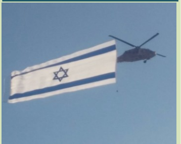
מצטרפים לברכות, גאים בבנים ומאחלים להם הצלחה בדרכם החדשה