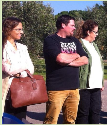
האותנטיות והעוצמה של החינוך הקיבוצי דורשים התייחסות ייחודית