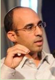
יחד, בהבנה הדדית ימצא פתרון יצירתי