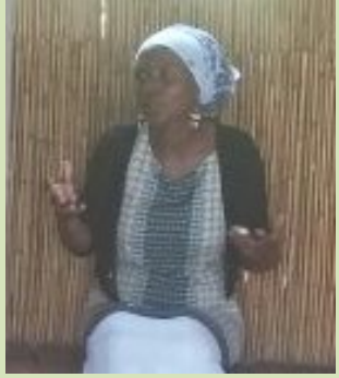
קריאה למעורבות ושיתופי פעולה עם כפרי הנוער