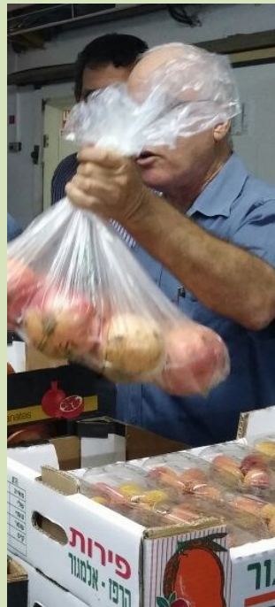
המכון הוולקני - חוד החנית של המחקר החקלאי בעולם