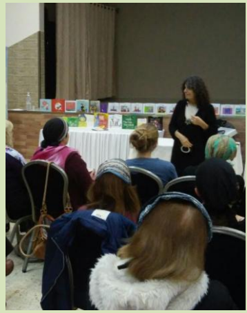
דובר על חשיבותן של האותנטיות ותודעת הלב בתהליך החינוך