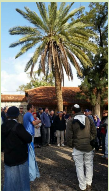
שלושה ימים קסומים השאירו טעם של עוד וכמיהה לשמיטה הבאה...