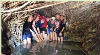
הילדים בישלו, טיילו, שיחקו ובעיקר נהנו מהחברותא שנוצרה