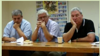
מאות חקלאים ימצאו עצמם ללא פרנסה מבלי שהצרכן ירוויח משהו