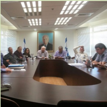
נדרש טיפול בסוגיות המחלוקת על מנת לאפשר חיים בכבוד