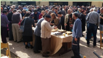
תשתית לוגיסטית מרשימה והרצאות, סיפורים אישיים, תמונות, שירים וסיורים