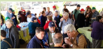
שבתות עיון ונופש