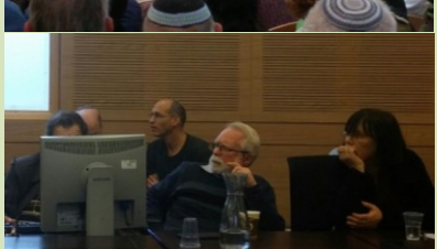
הלאמת מפעלי מים פרטיים בהם הושקעו 12 מליארד ₪! העברת המונופול למקורות