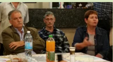
ההצעה מונחת על שולחנה של אסיפת חברים – קליטת בנים חילוניים כחברי קיבוץ