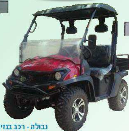
נבולה - רכב בניין חדש בשוק