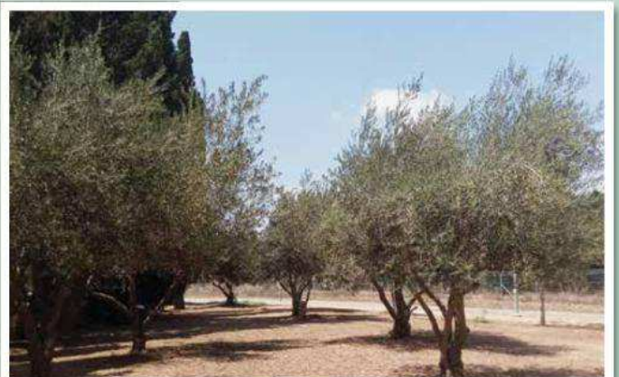
חלקת זיתים בטיה הקיבוצי