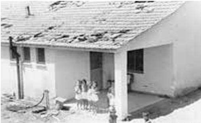
בית הילדים ברוחמה אחרי החיפוש של האנגלים