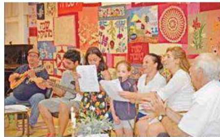
מתוך קבלת השבת, בית השיטה ומחנות העולים

במסגרת חג ה-90 לקיבוץ בית השיטה ציינו חברי וחברות הקיבוץ את הקשר לתנועת הנוער המחנות העולים, שחבריה היו מייסדי הקיבוץ.