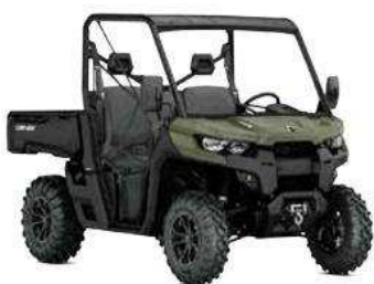
TRAXTER PRO HD8

יוצא לעבודה? אתה מוזמן להכיר את TRAXTER - השותף האולטימטיבי שלך לכל משימה. הוא מצטיין בעבודה עם מבנה קשוח, יכולות מצוינות בעומס ועם אמינות מוכחת. וכדי להקל עליך במהלך יום העבודה הוא מעניק לך ולנוסע מרחב ייחודי, נוחות ובטיחות כמו שלא הכרת. TRAXTER טרקטור משא חדשני של CAN AM.