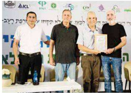
לב עמי בשן - ענף יצוא ייחודי, "YOKNEAM COTTON"