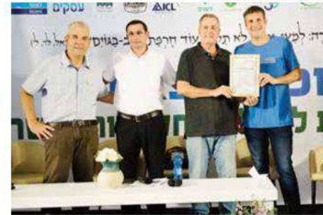
צוות הדיר של קיבוץ גזית - העדר גדול פי חמישה

רבים. היום נותרו ביקנעם שלושה מגדלים, הנושאים יחדיו בגאווה את המותג YOKNEAM COTTON. הענף עתיד ידיים עובדות ויודע גאות ושפל ע"פ משתנים ומשפיעים רבים בארץ ובעולם. המשק של לב עמי חידש פעילות ב-1977 ומתחילת שנות השמונים הצטרפו לגידול כותנת הנוי. מאז הם מגדלים ברצף עד היום. ענף הכותנה לנוי ייחודי בתחום היבשים ומיועד ליצוא לארצות רבות, במערב ומזרח אירופה, מזרח אסיה וארצות נוספות.