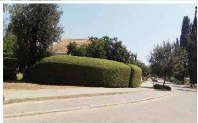
שיחים קטומים נטוח ורסאי

בתקופה בין הקמת הקיבוץ לשנות החמישים היו גידולים חקלאיים בשטח הנקודה, שללא כוונת מתכנן היו חלק מגן הנוי הקיבוצי הצעיר. גן ירק (שנקרא ג'ובית) שסיפק את צורכי הירקות באיכות משובחת. לידו ניטע מטע גויאבות שעשו מהם לפתן טעים. היה כרם ענבים כפאתי הקיבוץ שכיילדים נהניו ממנו מאוד. היה גם מטע רימונים קטן