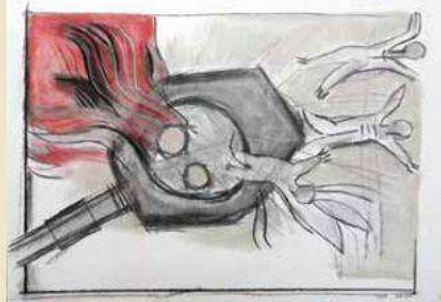
שפירא חזר בציוריו ורישומיו אל הטראומה של מלחמת יום הכיפורים, אחרי 40 שנה שבה לא צייר

במכון לציור ופיסול ע"ש אבני בת"א. שמחתי לשמוע מאליי שם שהוא חזר לציור אחרי הפסקה ארוכת שנים. הייתי סקרן