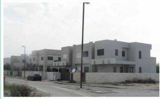
המראה הקיבוצי החדש

התפיסה החדשה המוצעת - אדם יושב תחת גפנו ותחת תאנתו, והארץ (הקיבוץ) זבת חלב ודבש. הגן שהוא הגוף הפנימי של הקיבוץ, נמשך אל מעבר לגדר המתנה, הוא בוסתן חקלאי מניב, מגוון, מייצג את קשת הגידולים החקלאיים שמתאימים לטיפוח לשם איסוף מהסוג שמתאים לסביבת מגורים (יש לברוק וקטיף עצמי. לצד צמחים יהיו גם חיות משק כמגוון, המיקום הסדר במרחב - כולם נועדו