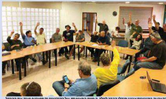
ההצבעה במזכירות איגוד מגדלי הבקר לחלב החיות המאוחדת של הקיבוצים והמשקים בצהר את ההבדל