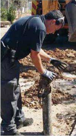
רקוט שמצאה השבת בשטח תיכון "שער הנגב" ו"היחיד בנק הכלכלי בשל מצב היחידים המתמשך"

לא מובנת מאלה, וכל יום עבודה שמסתפס, מתבטל או משתנה יוצר עבורם קושי כלכלי שרק הולך וגדל ככל שהתקופה מתארכת ונעשית למעין "חירום מתמשך". אם קברניטי המדינה יקבלו בקשוֹתיהם, יהיה בזה חיזוק משמעותי וחשוב מאין כמוהו לחוסן האישי והקהילתי של תושבי היישובים באזור.