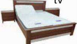
מערכות מתכונות tv

פולירון מבצע חורף* מבצעים מיוחדים לקיבוצים