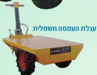
עגלת העמסה חשמלית