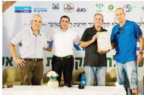
משפחת פולק - שינוף פעולה בין-משפחתי מלא