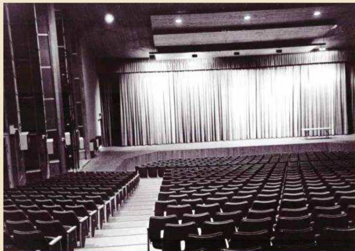
פנים אולם המופעים בעין השופט. אדריכל - שמואל מסטצ'קין

למען הגילוי הנאות אספר, שפעם לפני חמישים שנה למדתי עם אלישע בחוג לאמנות של ההתיישבות העובדת