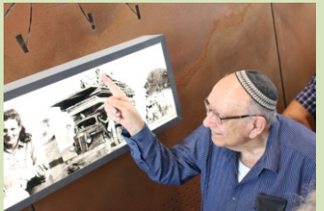
פרויקט ממשלתי ואתר מורשת לאומי שהוקם בהשקעה גדולה מאוד