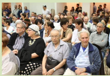
למדנו מהי גבורה של משפחה אחת ששכלה 3 מבניה וכיצד התנחם האב בעצמאות ישראל

הדין בכרסאות יתרום כבדת לשון עמדה הסליחה ירים כוסית על סף הפה הרחמים יפסו כשלוילית של תכלת היו הרחמים על המרפסת, מתדפקים האהבה על בהונות תלך האהבה התלטפה בחדר הסליחה לא תעבר שוב את הסף אבל הדין טפס בחלון * קגנב (שלוש נקישות) ומן הרקב הלבו, ליד הבית, יצאו שלושה: באחת ימד המקרה הגדול, הגבור והנורא באחת תשח הרוח ועמם הבשורה באחת יהא העגן פורח * והחלום יעוף הגדול בדלת מבוכת-צלו הטיל * הגבור שלח נדו מן הנדית, ונתרחק החדר הפנימי יגתר הנורא לבדו נגש כשהיה * או שלא