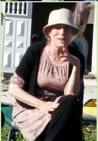
הזדמנות לשוחח בצורה מורכבת, להצליח להקשיב לדעות שונות