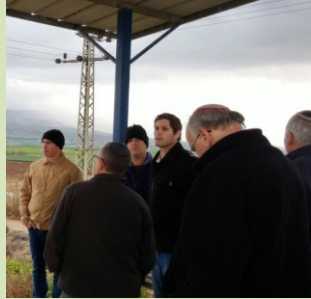
רוח טובה, חוסן חברתי וכלכלי, הנהגה, הובלה וניהול