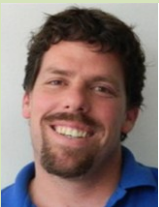
הפחת רוח חיים מחודשת בזהות היהודית