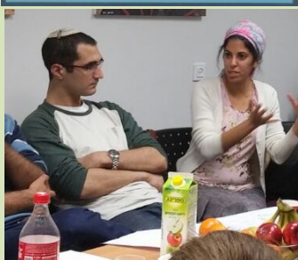
לא רק לימוד אלא עשייה של ממש. כיצד תשפיע? ימים יגידו...