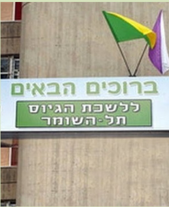
רענון קשרי עבודה עם הגורמים המטפלים בכל נושא הגיוס לצה"ל