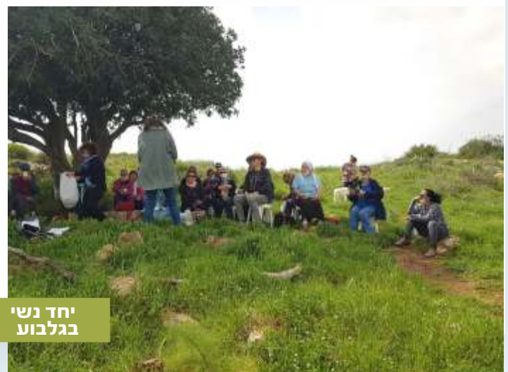
יחד נשי בגלבוע