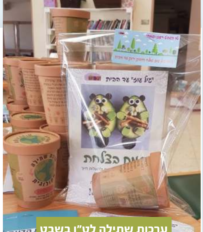
ערכות שתילה לט"ו בשבט