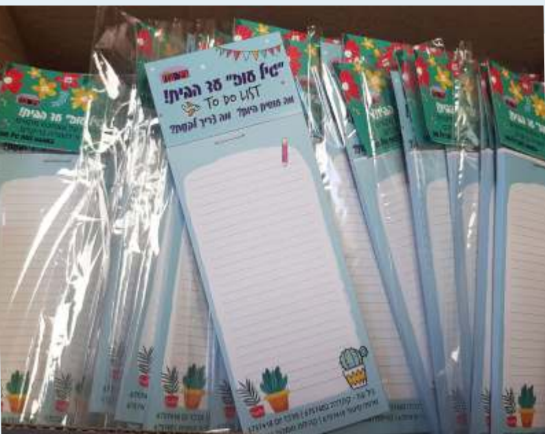
רושמים, מתארגנים ומתכננים