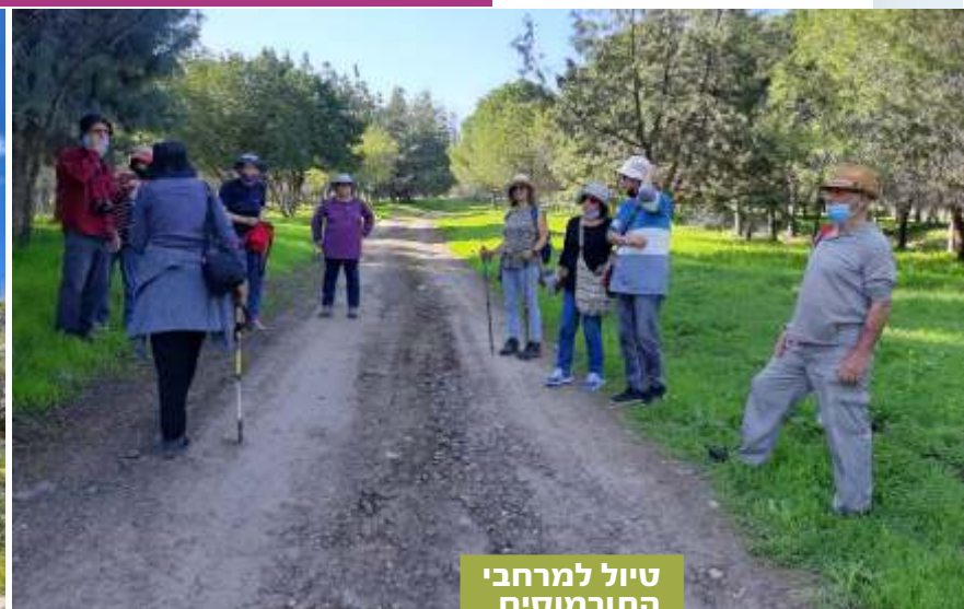
טיול למרחבי התורמוסים