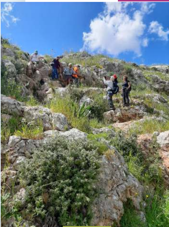
ותיקי השביל בנחל תבור