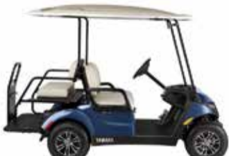
רכבים תפעוליים בנזין/ חשמלי