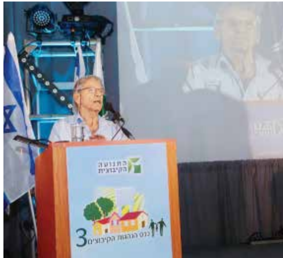
עמוס עוז נושא דברים בכנס הנהגות הקיבוצים. צילום אמנון גוטמן

"משפט המפתח שאני חוזר ואומר אותו לישראלים ולפלסטינים: אנחנו לא לבד בארץ הזאת, אתם לא לבד. האם יש סיכוי שנוכל להפוך למשפחה אחת מאושרת? מה פתאום. אי אפשר לקפוץ למיטת ירח-דבש אחרי מאה שנים של שנאה ושפיכות דמים. צריך לחלק את הבית לשתי דירות יותר קטנות. עמוק בלב אין כמעט אדם שאינו יודע זאת. איך לחלק את הבית אפשר להתווכח. אם מותר לי להשתמש בדימוי, ומותר לי כי אני חי מזה: הפציינט, ישראלי ופלסטיני, כבר יודע שהוא צריך ללכת לחדר ניתוח. האם הוא מאושר? לא. האם הוא ילך לחדר הניתוח בשמחה ובששון? לא. הדוקטורים פחדנים. משני הצדדים. גם הם יודעים שצריך ניתוח. האם זה יקרה בימי חי, בקדנציה שלי? אינני יודע. אני יודע שאין דרך אחרת. אנחנו והפלסטינים לא נהפוך למשפחה אחת מאושרת בזמן הזה. אנחנו לא משפחה, אנחנו