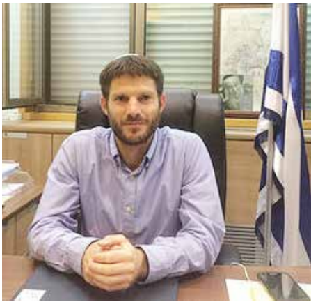
ה"כ סמוטריץ', הפוליטיקאי הבכיר של הציונות הדתית בשנים הקרובות?

כן למד משפט ציבורי ובין-לאומי לתואר שני באוניברסיטה העברית בירושלים". מה אי אפשר ללמוד מאתר הכנסת לגבי סמוטריץ'? שלצבא הוא התגייס רק בגיל 28, לשירות מקוצרר כפי שכתב האלוף שטרן. בזמן שרוב בני גילו לבשו מדים, לו היו דברים חשובים יותר לעסוק בהם: הוא סיים תואר ראשון במשפטים בקריה האקדמית אונו במסלול אברכים והוס"מך כעורך דין, אחר כך השלים תואר שני באוניברסיטה העברית. ב-2005, עוד לפני השרות הצבאי, השתתף סמוטריץ' בפעולות המחאה נגד תכנית ההתנתקות ונעצר על ידי השב"כ שעקב אחריו. השב"כ תפס 700 ליטרים של דלק אצל חמישה אנשי ימין, סמוטריץ' ביניהם, והחשד היה