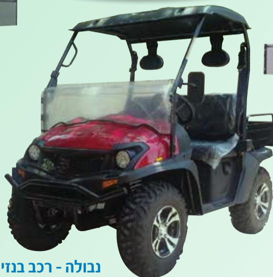
נבולה - רכב בניזין חדש בשוק