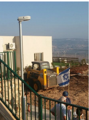
בית רימון - מודל מוצלח לשילוב כוחות שמביא לצמיחה