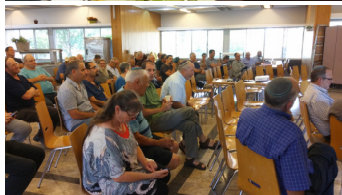
מהלך הרסני לענף שיביא לחסכון חודשי של 4-6 ₪ למשפחה!