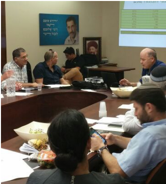
ביקשנו מהבית היהודי להוביל את המאבק על החקלאות וההתיישבות