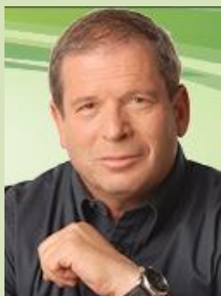
תומכים בעמדת חקלאי ישראל: כל רפורמה רק בהדברות עם החקלאים