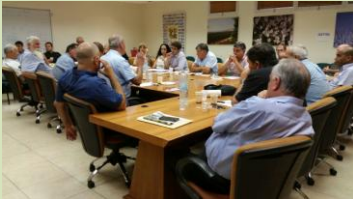
המזמו"ר יפגש עם תוכניות המקרבות צעירים לעבודה חקלאית