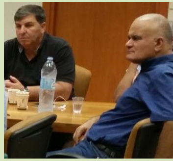
קיימת סבירות גבוהה שנאלץ לצאת למאבק. ההכנות לכך כבר החלו