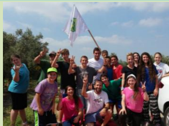
רוח ספורטיבית של ילדי ז' במירוץ - 'טבילת אש' ראשונה לתוך התנועה

אבו (אבשלום) וילן, מזכ"ל התאחדות חקלאי ישראל, שלח השבוע לכל החקלאים, איגרת הנפתחת במילים אלה: "משרד האוצר הודיע למשרד החקלאות על שורה שלמה של גזירות ומהלכים חד-צדדיים שבכוונתו להוציא לפועל. מהלכים אלה יחסלו ענפים חקלאיים שלמים, לרבות: ביטול התכנון בענף הצאן; ביטול תוך שנתיים של התכנון בבצרים; פתיחה מיידית של מכסות הדגים והוצאת הפקטס מכל תכנון". בהמשך האיגרת מסביר אבו את המשמעויות של צעדי האוצר, שבעיקרן נשענות על למידה מן העבר: ביטול תכנון הייצור בענפי החקלאות לא הוכיח את עצמו, המחיר לצרכן רק עלה והחקלאים הפסידו. לעומת זאת מברך אבו את ההנהגה החדשה של משרד החקלאות, ובראשם את שר החקלאות אורי אריאל, את מנכ"ל משרדו שלמה בן אליהו ואת הסמנכ"לים הבכירים, "אשר מבינים ומזדהים עם עמדותינו בנוגע לעובדים הזרים ופערי התיווך, ומקדמים שינויים בחוק ההסדרים הקרוב". כידוע, משקיני מתבססים על ענפי החקלאות, ואנו תומכים בעמדת חקלאי ישראל, ומצטרפים לתביעתם מהממשלה "שכל רפורמה שהמדינה תרצה לבצע תהיה אך ורק תוך כדי הידברות עם החקלאים ולא מעל לראשיהם".