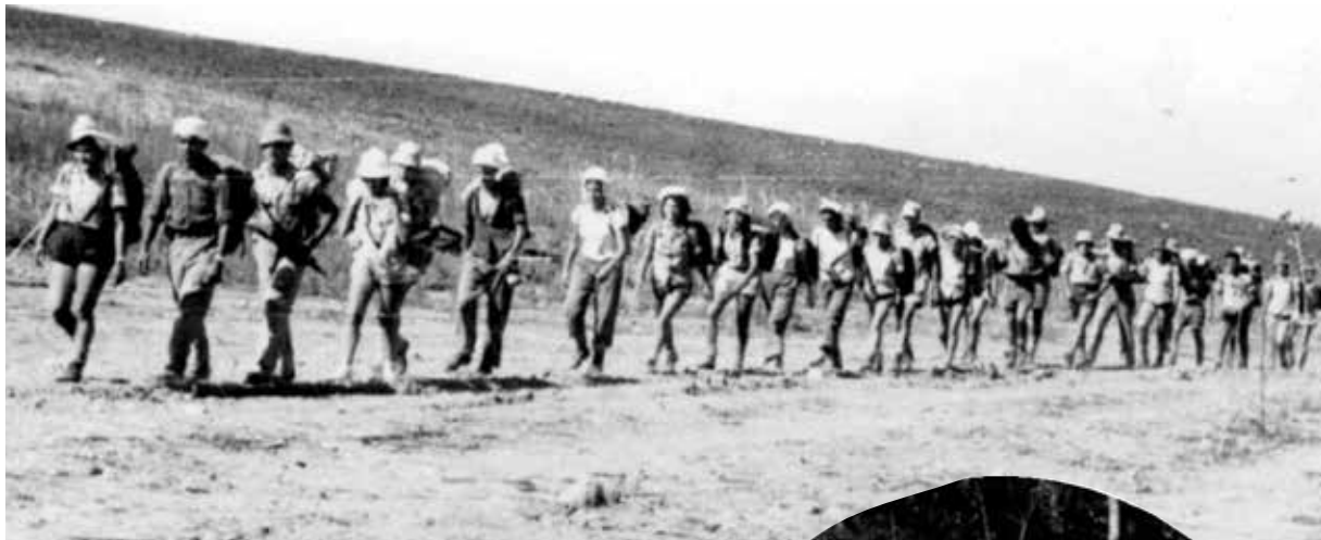
הקבוצה בטיול תנועתי