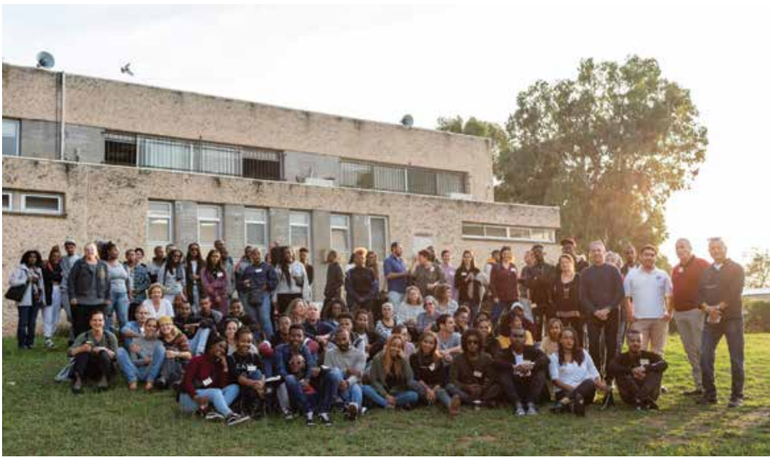
תמונה קבוצתית של חניכי תל"מ, המדריכים ואנשי התנועה הקיבוצית