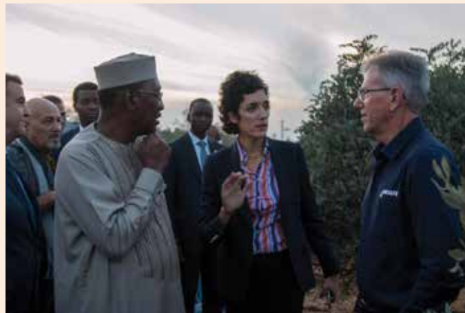
נשיא צ'אד במטע החוובה בחצרים

ש ני ביקורים דיפלומטיים חשובים מאד נערכו בשבוע שעבר בישראל, ביום ראשון נחת בארץ נשיא צ'אד אידריס דבי, לאחר נתק דיפלומטי שהחל בשנת 1972. בנוסף, בהמשך השבוע הגיע לביקור ממלכתי נשיא צ'כיה מילוש זמאן. מלבד הפגישות עם ראשי הממשל בישראל והביקורים באתרים ההיסטוריים לא ויתרו השניים גם על סיור בקיבוצים - נשיא צ'אד סייר בקיבוץ חצרים, שם ביקר במפעל "נטפים" וסייר במטעי החוובה. נשיא צ'כיה סייר בקיבוץ נחל-עוז. בביקורו בחצרים סייר נשיא צ'אד במטע חוור בה, במהלך הסיור נפגש עם נציגים מהקיבוץ ומנטפים, נחשף לחקלאות המדברית ולחקלאות הדיגיטלית. בעוד שנטפים פועלת בציאד כבר למעלה מ-20 שנה, הנשיא דבי הביע עניין בפיתוח ושיתוף פעולה חקלאי במדינתו. נשיא צ'אד מצטרף לרשימה מכובדת של מנהיגים אפריקאים המעוניינים לאמץ את הידע המקצועי של נטפים ואת הפתרונות לחיסכון במים בקנה מידה בינלאומי. למחרת, ביקר נשיא צ'כיה בנחל-עוז ביחד עם