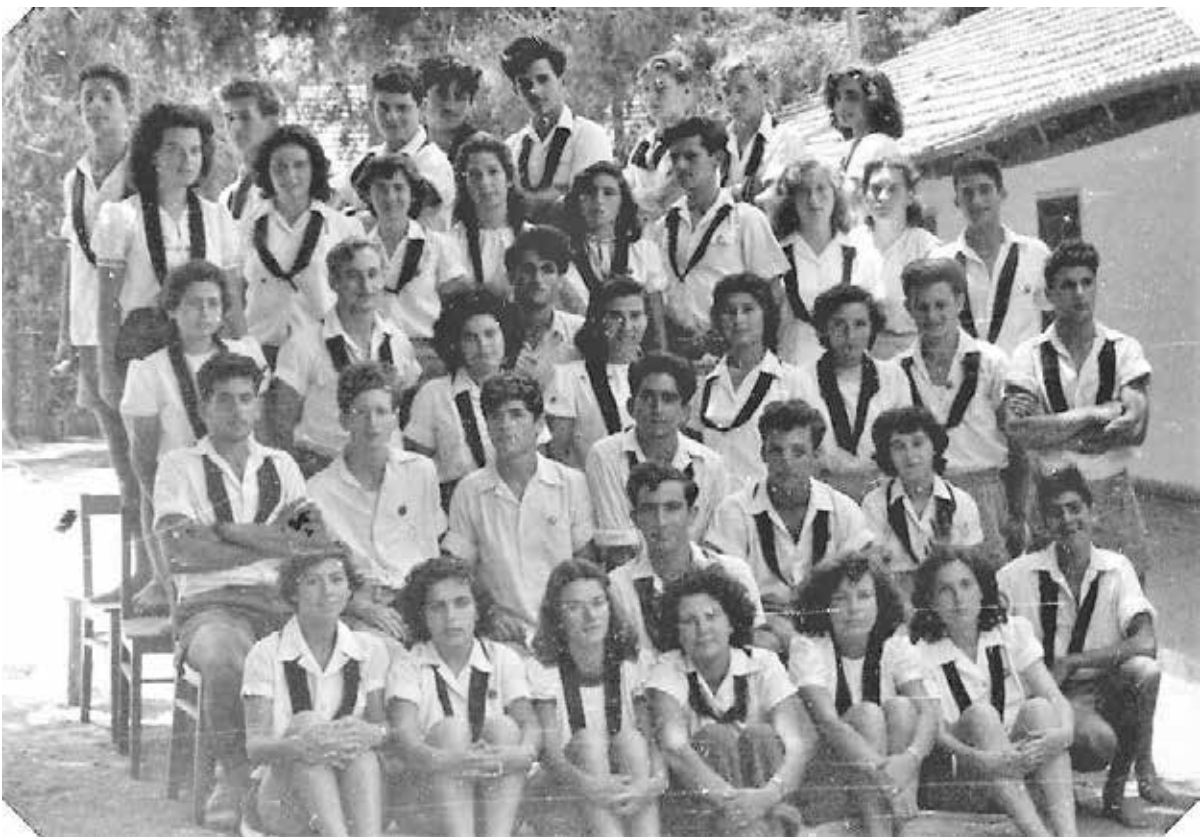
קבוצת לפיד עם עניבות שחורות, מוסד שריד, שנות ה-40