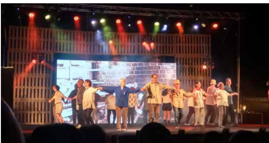
כל משפחה בקיבוץ הייתה מיוצגת על הבמה לפחות עם משותף אחד.

בחגיגות ה־80 הוצגה תערוכה של עשרות אמנים ציירים חברי הקיבוץ וכמועדון לחבר, בנוסף לתמונות וסיפורים מיום ההקמה ועד היום, הוצגו הכלים השימושיים בהם השתמשו בכפר רופין ולמעשה בכל קיבוצי התנועה הקיבוצית לדורו תיה כמו פתיליה, מכשיר במטבח לעשיית "לוק" שים" וקבקים במקלחת: המשותפת.