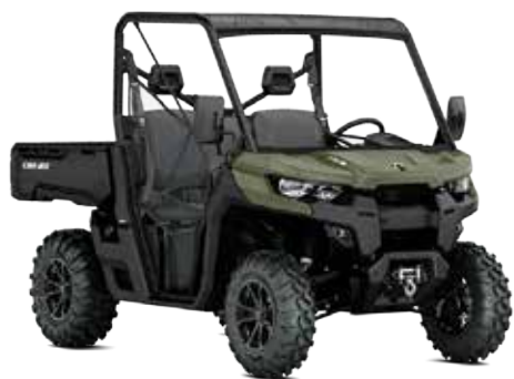
TRAXTER PRO HD8

יוצא לעבודה? אתה מוזמן להכיר את TRAXTER – השותף האולטימטיבי שלך לכל משימה. הוא מצטיין בעבודה עם מבנה קשוח, יכולות מצוינות בעומס ועם אמינות מוכחת. וכדי להקל עליך במהלך יום העבודה הוא מעניק לך ולנוסע מרחב ייחודי, נוחות ובטיחות כמו שלא הכרת. TRAXTER טרקטור משא חדשני של CAN AM.