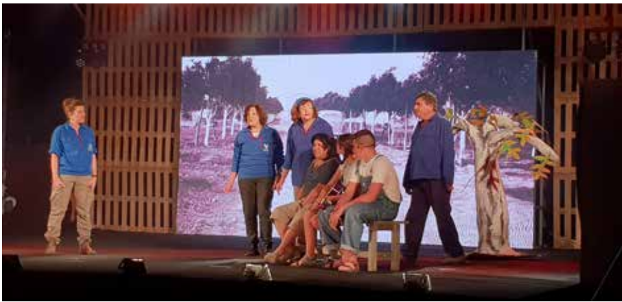
ילדים מגיל 7 וותיקים מעל 70 השתתפו במחזמר על כפר רופין, כולו בהפקה עצמית.