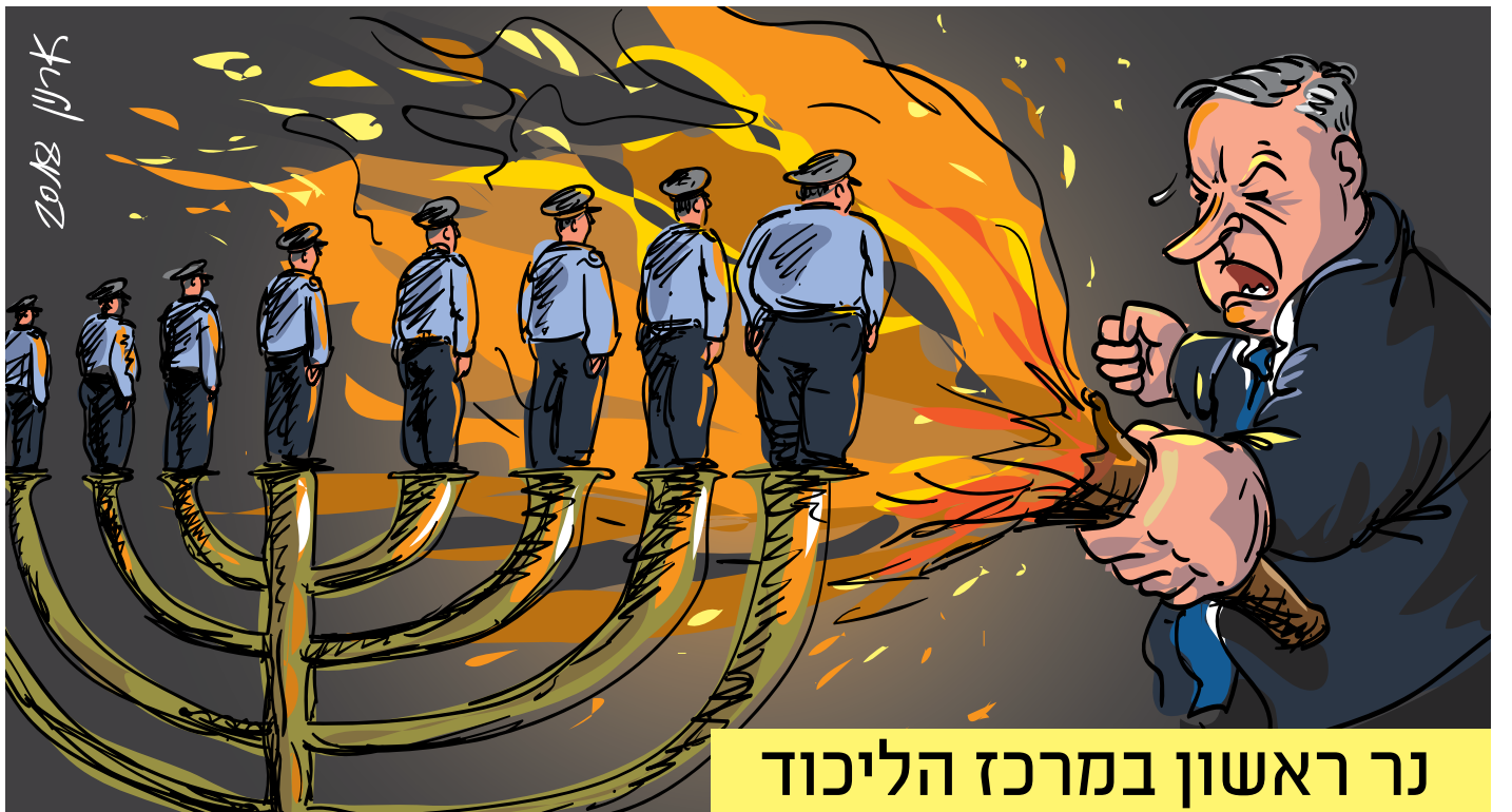
נר ראשון במרכז הליכוד

אזרחים שנחשבו למחבלים ומצאו כך את מותם, היו על אגף הפליטים אותה הטביע עה צוללת של חיל הים הישראלי במלחמת לבנון הראשונה מול חופי לבנון. 25 אזרחים, פליטים. הסוד מאחורי "מבצע דרייפוס" שנשמר במשך 36 שנה, נחשף בחדשות 10 והיה אמור לעורר קצת יותר התייחסות, אבל הוא נגנז מהר למדי. לא נעים לעסוק בפשלות של צה"ל, בוודאי בכאלה שלא מסתדרות עם הגדרתו כצבא המוסרי בעולם. על שידור הכתבה זכה ערוץ 10 לתגובות מחמיאות כמו "הלוואי ויסגרו את הערוץ המ"טונוף הזה ובהקדם, עוכרי ישראל". או: "מה