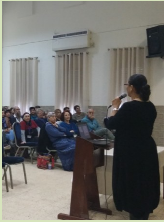
תחושה של סיפוק גדול מהעלאת נושא הגיל השלישי בתנועה

השבת יתקיים בקבוצת יבנה סמינר ל- 60 בני ובנות כיתה י' מרחבי תנועת הקיבוץ הדתי. הסמינר יעסוק במתח בין הכלל לבין הפרט בתחום הכלכלי-חברתי. יבחנו בו יחסי הפרט והכלל בחברה דרך הפרדגימה הכלכלית. נברר האם מקורות היהדות מנחים אותנו בסוגיה נצחית זו , ונעמת את המצוי עם הרצוי במדינת ישראל. נעלה שאלות לדיון ונבקש למצוא את התשובות בלבבות המשתתפים. חוויות, רשמים ותודות- בשבוע הבא. בינתיים אהלו לנו, שבת מוצלחת, מעניינת ומרוממת.