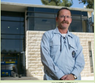
פגשנו שוב את רוח ההתנדבות של אנשי תנועות ההתיישבות