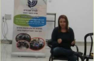
פורום איכותי הפתוח לכל צעיר או צעירה שמגלים עניין