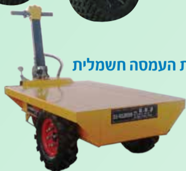
עגלת העמסה חשמלית