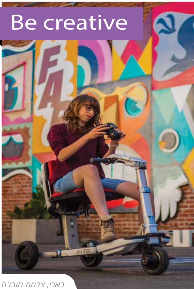
בארי, צלמת חובבת

עם סדדו , דבר לא יעמוד בינך לבין התחביבים שלך