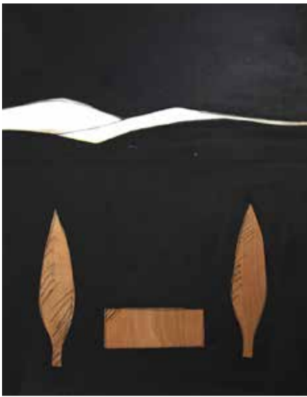
אופק לבן - אקריליק על בד ודיקט - 1983