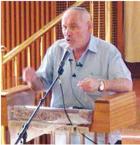
חנן פורת ז"ל. הריאיון עם רינה מצליח, "ערוך, חתוך ומגמתי"?