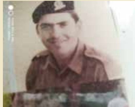
דבורה מ"פ פלוגה ב'

סמוך לפרוץ מלחמת השחרור פונתה מנהיגים ריים האוכלוסייה האזרחית, ונותרו בה כמה עשרות עובדים בעלי תעודות זיהוי ירדניות, בתקווה שהירדנים יתירו להם להמשיך להפעיל את התחנה גם בעת חרום, אלא שתקיפתם של פרנסי המקום נתבררה חיש מהר, ולימחרת הכרזת המדינה