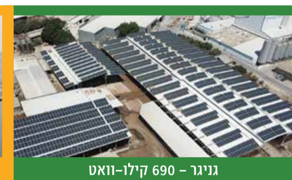
גניגר - 690 קילו-וואט