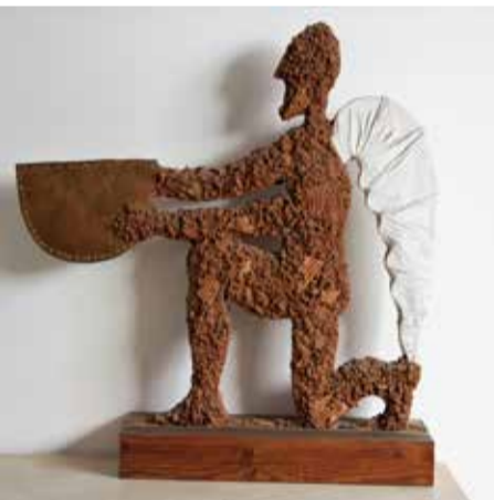
מנחה - טכניקה מעורבת - 1994

באחד מטיוולי בפסל הברונזה של אלכסנדר ז'ייד בשיח' אבריק, משקיף ממרום מושבו על מורדות עמק יזרעאל. בטיוולים מאוחרים יותר באירופה פגשתי בכיכרות גנרלים לבושי שריון ומדים עם סמלים ומרליות, רוכבים על סוסי אנדרטאות לתפארת ניצחונותיהם. אנח' נו נמצאים כבר שנים במסעי צלב דו-סטריים, כל צד ומלחמת הקודש שלו, כל צד ונרצחיו. המשותף למסעי הצלב הוא הרבקות הקנאית בדם ובמילים הקרושות שאין עמהן סליחה והבנה... לא אחת אני חש כי אני נמצא במ' נהרת הזמן אי שם בחשכת ימי הביניים וצופה בחררה איך מועלים על המוקד כל עצי הברו' שים אשר אהבתי." וסיד: "יש בתערוכה פסל אחד שקוראים לו 'בין אלכסנדר לקוליאוני'. הפסל מציג שני פרשים שעומדים אחד אחרי השני, הראשון הוא של קוליאוני, גנרל איטלקי עתיר ני' צחונות, הסוס הוא סוס גאה, סוס מצעדים,