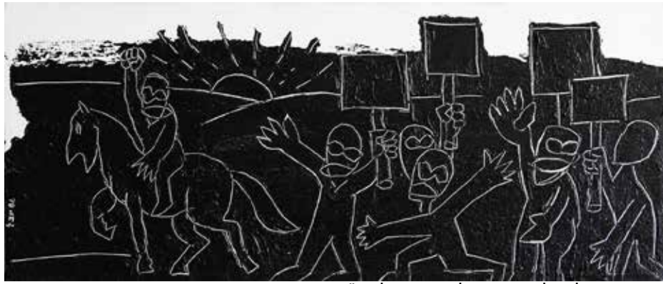
הכנה - אקריליק על בד - 1986.

באחד מטיוולי בפסל הברונזה של אלכסנדר ז'ייד בשיח' אבריק, משקיף ממרום מושבו על מורדות עמק יזרעאל. בטיוולים מאוחרים יותר באירופה פגשתי בכיכרות גנרלים לבושי שריון ומדים עם סמלים ומרליות, רוכבים על סוסי אנדרטאות לתפארת ניצחונותיהם. אנח' נו נמצאים כבר שנים במסעי צלב דו-סטריים, כל צד ומלחמת הקודש שלו, כל צד ונרצחיו. המשותף למסעי הצלב הוא הרבקות הקנאית בדם ובמילים הקרושות שאין עמהן סליחה והבנה... לא אחת אני חש כי אני נמצא במ' נהרת הזמן אי שם בחשכת ימי הביניים וצופה בחררה איך מועלים על המוקד כל עצי הברו' שים אשר אהבתי." וסיד: "יש בתערוכה פסל אחד שקוראים לו 'בין אלכסנדר לקוליאוני'. הפסל מציג שני פרשים שעומדים אחד אחרי השני, הראשון הוא של קוליאוני, גנרל איטלקי עתיר ני' צחונות, הסוס הוא סוס גאה, סוס מצעדים,