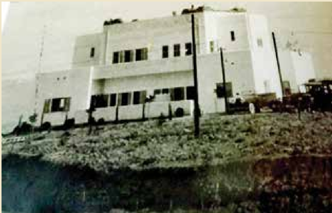
בית המנהל - החזית דרומית מערבית

בשלהי שנת 1968, במהלך מלחמת ההתשה בעמק הירדן, נשמע בשעת לילה מאוחרת פיצוץ עמום מכיוון שכונת תל אור, שבעקבותיו נחרב ביתו של 'הוקן מנהריים'. היה זה מבנה דו-קומתי