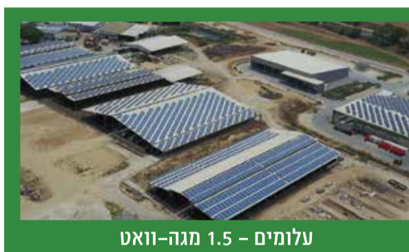
עלומים - 1.5 מגה-וואט