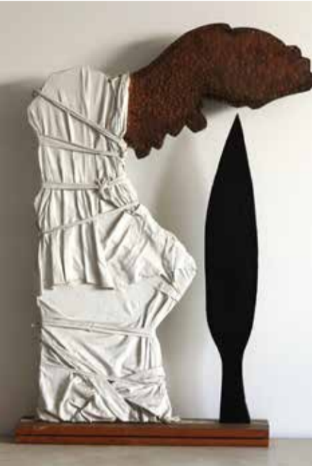
ברוש שחור - בד, עץ ונחושת - 1987