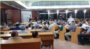
מעגלי לימוד ברוב עם ובאוירה ייחודית ומרוממת