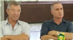
כולנו תקווה שיעלה בידינו להגשים את כל תכניותינו