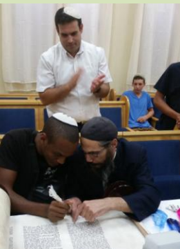
האחים החליטו שכפר הנוער ראוי להנצחת יקיריהם