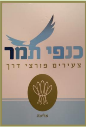
לשתף בדרכה של תמר: ציונות, אהבת הארץ ותרומה

כפר הנוער נווה עמיאל זכה השבוע להכניס ספר תורה חדש לבית הכנסת המקומי. שלושה אחים שכתבו ספר תורה לזכר הוריהם, חיפשו עם השלמתו, באמצעות הפייסבוק, קהילה הזקוקה לספר. ערנות הנהלת הכפר הביאה ליצירת קשר עם בני המשפחה, והם הזדרזו לבוא ולהתרשם מהכפר ומעשייתו החינוכית. לאחר הביקור החליטו האחים שהמקום ראוי להנצחת יקיריהם לאור העבודה החינוכית הנפלאה הנעשית בו, והשבוע – לאחר שהמכובדים ונציגי הילדים סיימו לכתוב את האותיות האחרונות – ליוו חניכי הכפר את המתנה היקרה והקדושה בשירים וריקודים מבית הכנסת במושב שדה יעקב אל ביתם הסמוך.