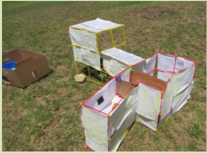
מי שנכח באירוע יצא בתחושה שיש לנו ילדים וצוותי הדרכה נפלאים!