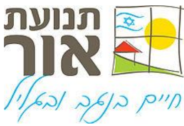
סוכס על תחילת שיתוף פעולה בתחומי צמ"ד ועל חשיבה בתכניות הצעירים