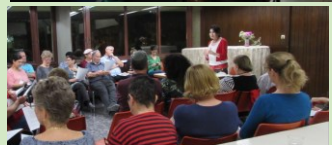
שיעור אחר שיעור, ניגון אחר ניגון, ערב מלא הנאה גדולה וצרופה