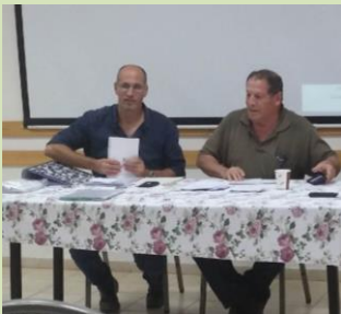
פה אחד נבחר אמיתי פורת למזכ"ל התנועה איחולי הצלחה!!!

למהירי החלטה ולספונטניים שביננו, דוגדגן ביצר – יומיים של חגיגה חקלאית ביער יתיר, ימים חמישי ושישי (מחר ומחרתיים) י"ח-י"ט אייר, 26-27.5 קטיף דובדבנים, שוק איכרים ואמנים, דוכני מזון, מופעי רחוב ופעילות אתגרית. פרטים נוספים באתר הקיבוץ הדתי.