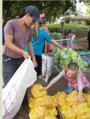
סוכם לפעול לקידום מינוי וליווי רכזי התנדבות בקיבוצים