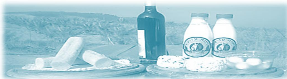
ההרשמה ע"ג לוח מודעות

ואדי א-ג'רם. במקומו יבחר מסלול הליכה אחר.